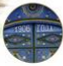
Ворота из с. Новая Бреть, с характерной цветной росписью