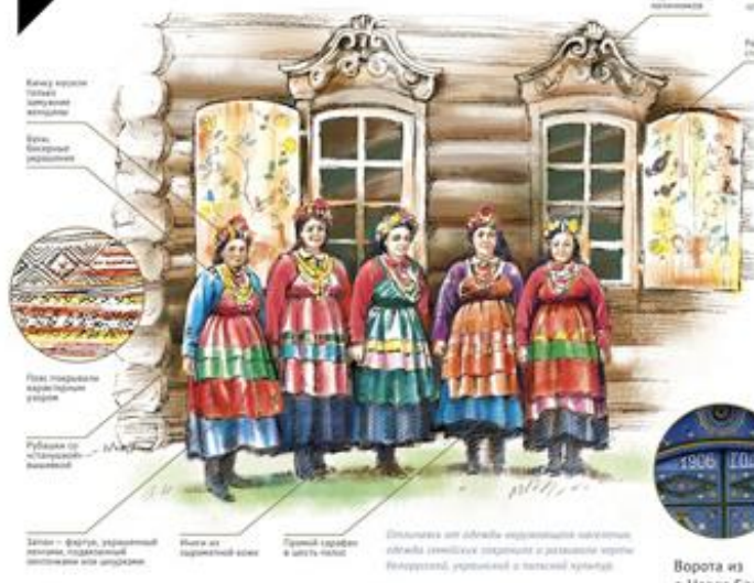
Канун юности (платье) — традиционная вышивка